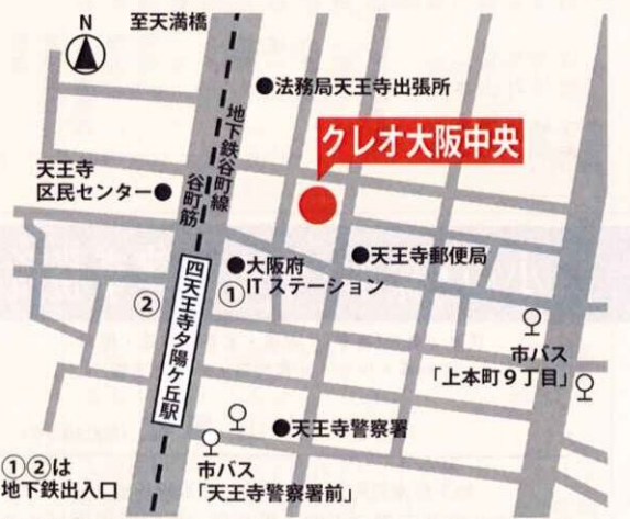
●地下鉄谷町線四天王寺夕陽ヶ丘駅1・2番出口から北東へ徒歩約3分