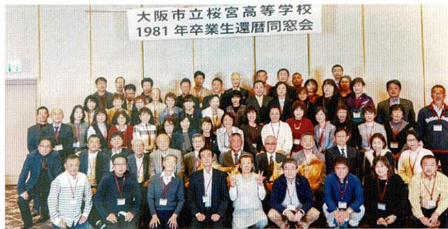
大阪市立桜宮高等学校 1981年卒業生還暦同窓会